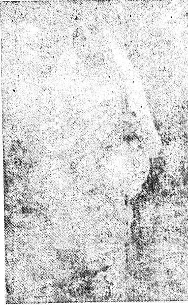
स्वर्गीया श्रीमती घसिट्टो